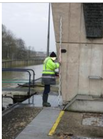
DREAL Grand Est/CEREMA 2018