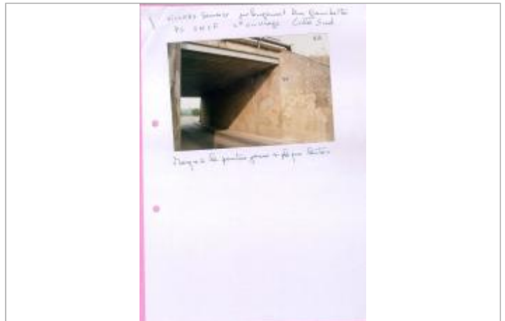
Photo Repères de crue (Site)

Coordonnées WGS84 : X: 4.75991000 / Y: 49.74170000