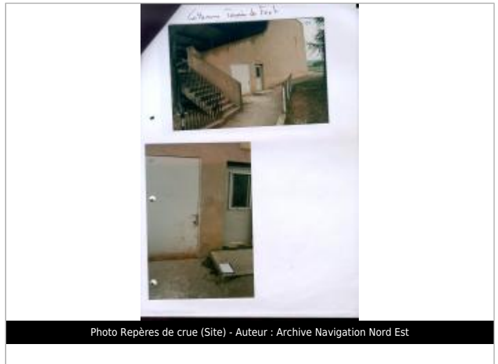
Photo Repères de crue (Site)