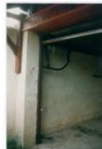
Gavisse Chalet le long de la Boler Site au sein du Garage

Photo Repères de crue (Site)