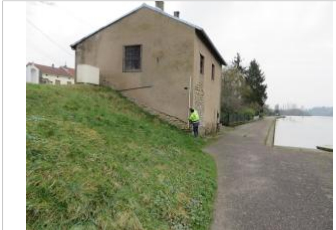
DREAL Grand Est/CEREMA 2018