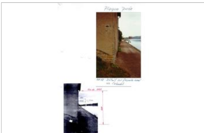
DREAL Grand Est/CEREMA 2018