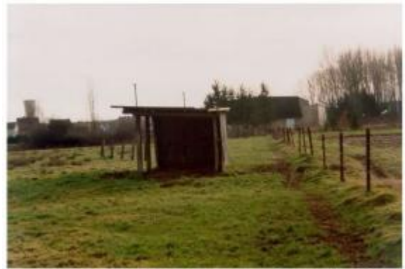
Basse Ham entre l'étang et Eurogranulats trace à 0,60m/TN

Photo Repères de crue (Site)