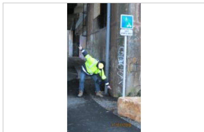
DREAL Grand Est/CEREMA 2018

GÉNÉRAL Code : AUTR_01-2018-01 Date de mise à jour : 12/12/2018 Auteur : Cerema Est