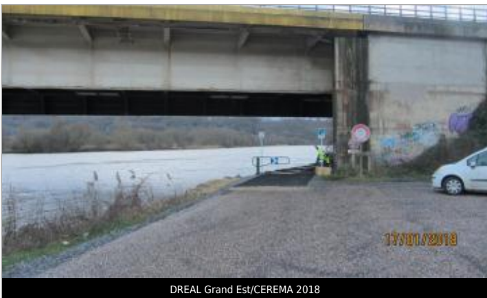
DREAL Grand Est/CEREMA 2018

GÉOLOCALISATION Coordonnées WGS84 : X: 6.10059000 / Y: 48.82510000 Coordonnées RGF93 (Lambert 93) X: 927580.93 / Y: 6862806.44 Coordonnées RGF93 (ETRS89) : X: 6.10059 / Y: 48.8251 Code Hydro: A---0060 Rive de référence: Droite