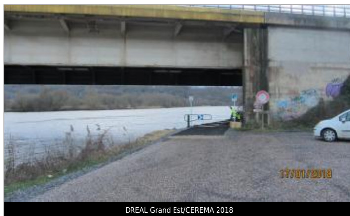
DREAL Grand Est/CEREMA 2018

GÉOLOCALISATION Coordonnées WGS84 : X: 6.10059000 / Y: 48.82510000 Coordonnées RGF93 (Lambert 93) X: 927580.93 / Y: 6862806.44 Coordonnées RGF93 (ETRS89) : X: 6.10059 / Y: 48.8251 Code Hydro: A---0060 Rive de référence: Droite