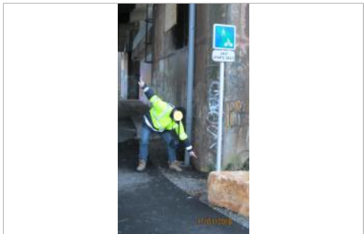
DREAL Grand Est/CEREMA 2018

GÉNÉRAL Code : AUTR_01-2018-01 Date de mise à jour : 12/12/2018 Auteur : Cerema Est