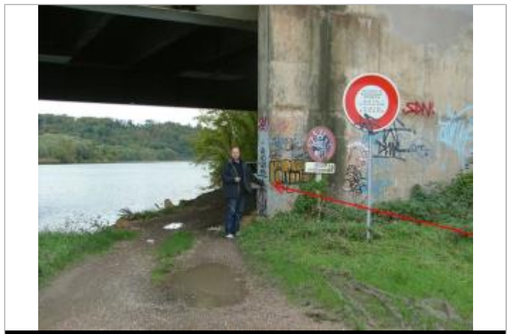
Archive Navigation du Nord Est

GÉNÉRAL Code : MEMO_Rep_4871 Date de mise à jour : 12/12/2018 Auteur : Cerema Est