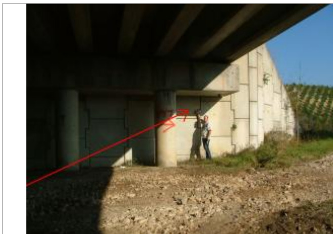
Photo Repères de crue (Site)