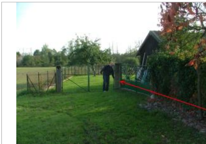
Photo Repères de crue (Site)

Coordonnées WGS84 : X: 6.48189000 / Y: 48.58110000