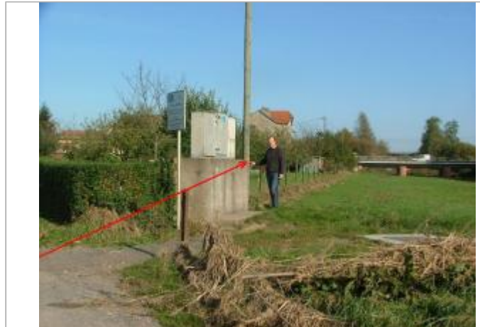
Photo Repères de crue (Site)

Coordonnées WGS84 : X: 6.47936000 / Y: 48.57990000