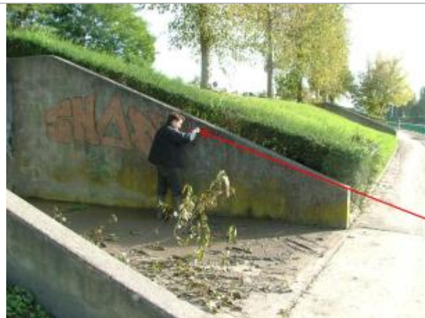
Photo Repères de crue (Site) - Auteur : Archive Navigation Nord Est

Coordonnées WGS84 : X: 6.17418000 / Y: 48.71650000