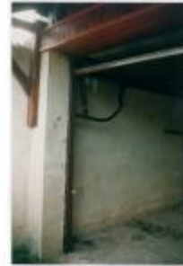
Repère de crue (Site) - Auteur : Archive Navigation Nord Est

Photo Repères de crue (Site) - Auteur : Archive Navigation Nord Est