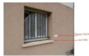
Photo Repères de crue (Site) - Auteur : Archive Navigation Nord Est