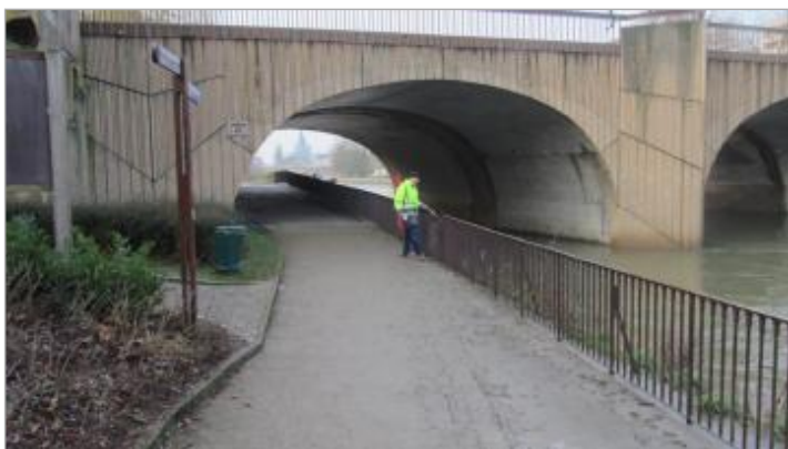
DREAL Grand Est/CEREMA 2018