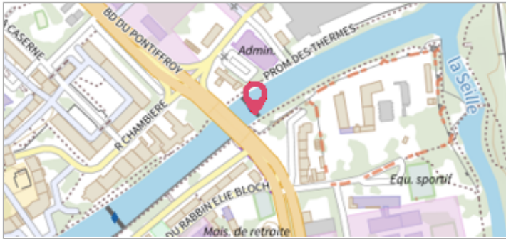
1525 PONT DES GRILLES Vue d'ensemble