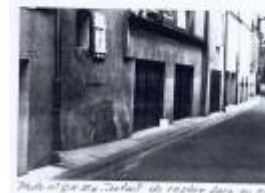
Photo n° 104-80-000 d'archive de la rue en allant vers l'église.

Photo Repères de crue (Site)