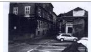
Photo n° 14-80-100 d'ensemble de la rue en allant vers l'église.