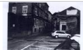
Photo n° 104-80-000 d'archive de la rue en allant vers l'église.