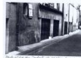
Photo n° 14-80-100-100000 de la rue en allant vers l'église.

Photo Repères de crue (Site)