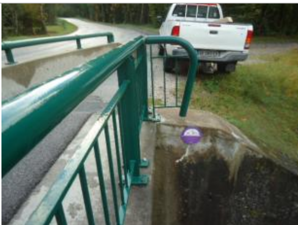
Pont de l'eau rouge 2003