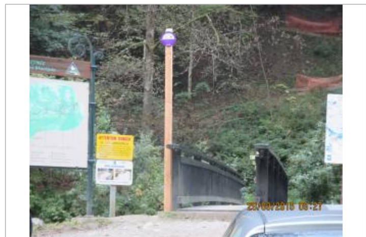
crue du 12/07/1892

MARQUE Texte : Le Bonnant 12 Juillet 1892 Plus Hautes Eaux Connues Maximum de l'inondation : Oui Visibilité : Oui État du repère : Bon Pérennité : Longue Repère calculé : Non PHEC : Oui