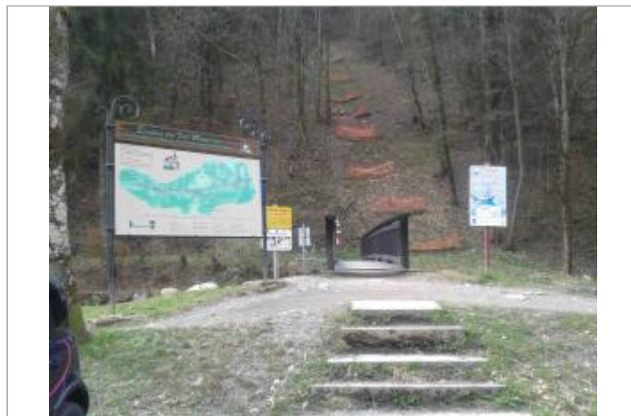
Site du parc thermal à St Gervais les Bains, pont sur le Bon Nant

GÉOLOCALISATION Coordonnées WGS84 : X: 6.70588980 / Y: 45.89759200 Coordonnées RGF93 (Lambert 93) X: 987238 / Y: 6539843.02 Coordonnées RGF93 (ETRS89) : X: 6.7058898 / Y: 45.897592 Code Hydro: V0020560 Rive de référence: