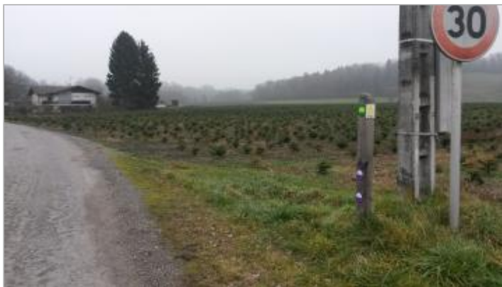
poteau de direction du cheminement de l' Arve (avant 2023)