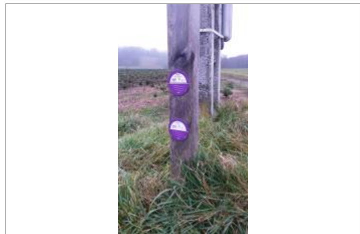
Repère sur le poteau de direction du cheminement pour la crue du weekend du 1er Mai 2015 (en bas)

Texte : L'arve 1-4 Mai 2015 Maximum de l'inondation : Oui Visibilité : Oui État du repère : Bon Pérennité : Longue