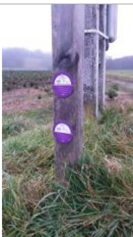
Repère sur le poteaux de direction de cheminement (en haut)