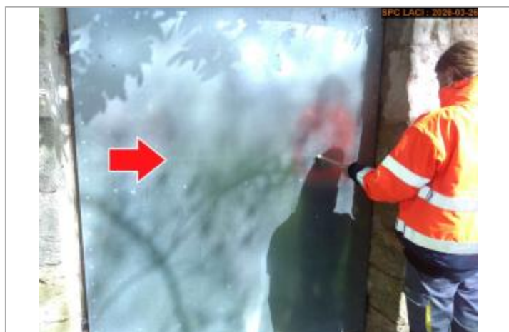
Vue du repère lors du recensement