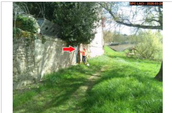
Vue du site en 2026