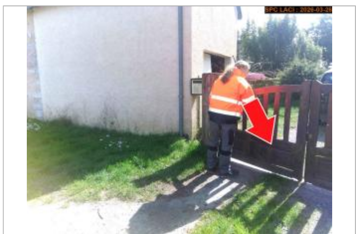
Vue du repère lors du recensement

MARQUE Maximum de l'inondation : Oui Visibilité : Oui État du repère : Disparu Pérennité : Aucune Repère calculé : Non renseigné PHEC : Non renseigné