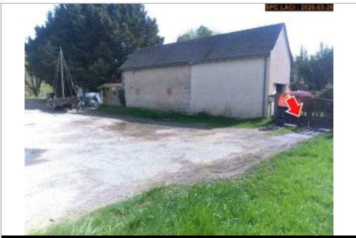
Vue du site en 2026

GÉOLOCALISATION Coordonnées WGS84 : X: 1.04450900 / Y: 47.32636100 Coordonnées RGF93 (Lambert 93) X: 552321.93 / Y: 6693610.34 Coordonnées RGF93 (ETRS89) : X: 1.044509 / Y: 47.326361 Code Hydro: K---0090 Rive de référence: Droite