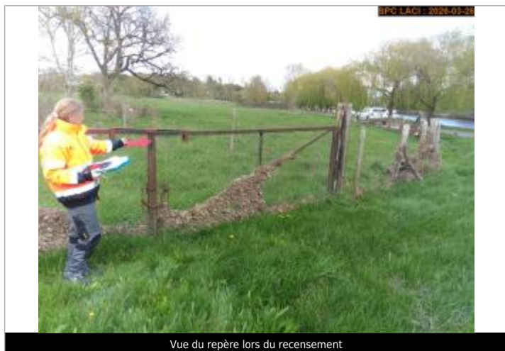
Vue du repère lors du recensement

Altitude calculée de l'eau (en m) : 58.296 m