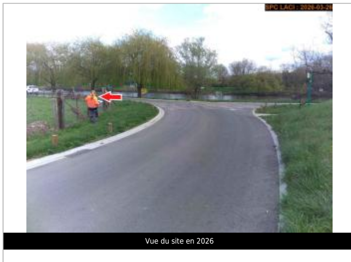
Vue du site en 2026