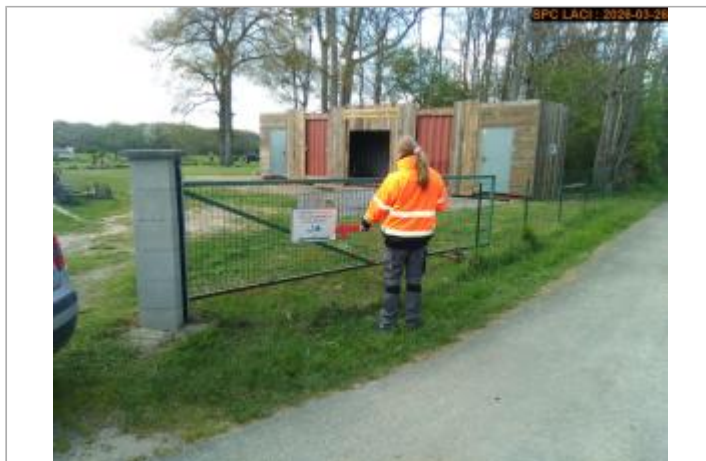
Vue du site en 2026