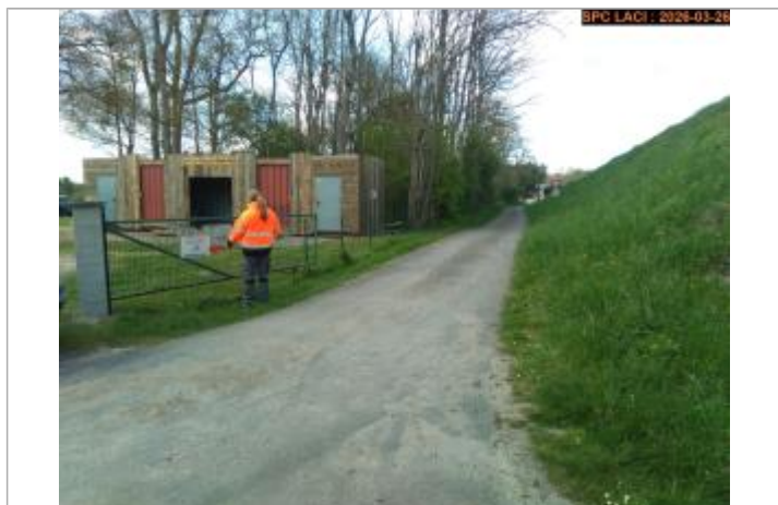
Vue du repère lors du recensement

SOURCE DE REPÉRAGE : SPC LACI, LE CHER ENTRE SELLES-SUR-CHER ET TOURS, CRUE DE FÉVRIER 2026 - 26/03/2026