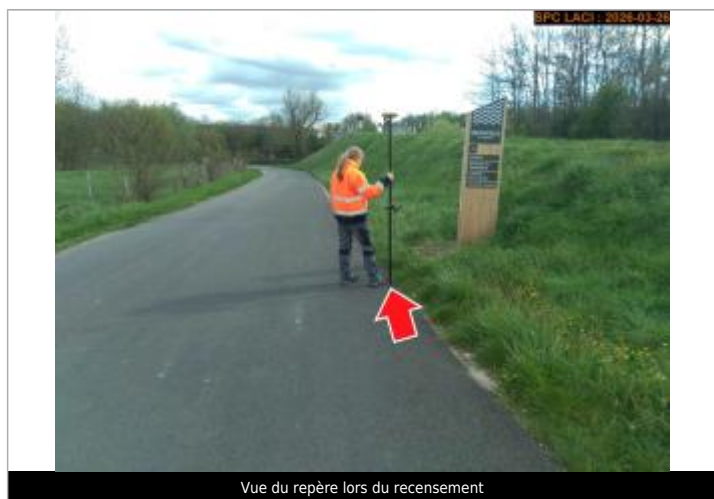
Vue du repère lors du recensement

SOURCE DE REPÉRAGE : SPC LACI, LE CHER ENTRE SELLES-SUR-CHER ET TOURS, CRUE DE FÉVRIER 2026 - 26/03/2026