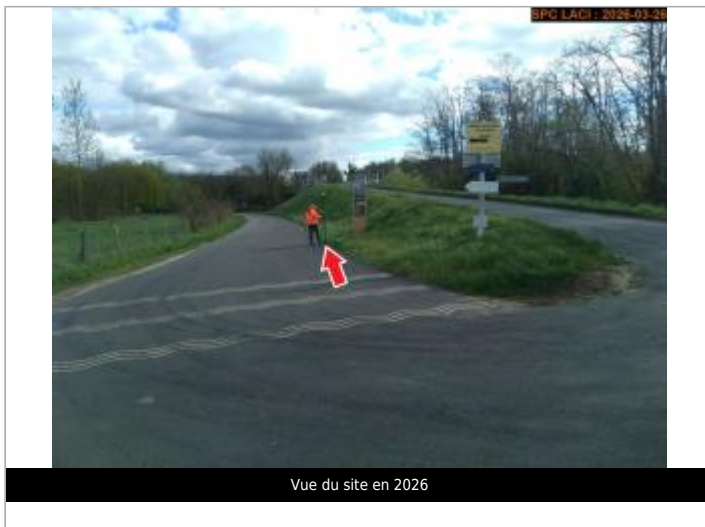
Vue du site en 2026