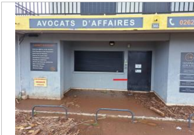
Vue générale du site, vue extérieure du bâtiment, DEAL Réunion, mars 2025