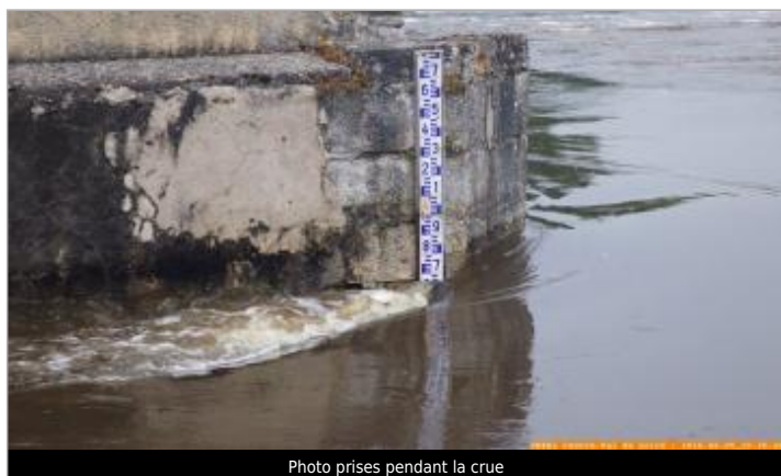
Photo prises pendant la crue