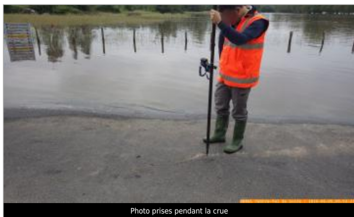
Photo prises pendant la crue