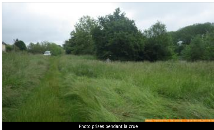
Photo prises pendant la crue