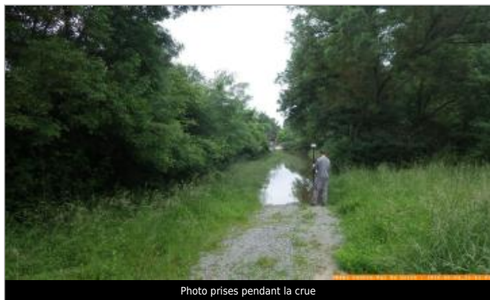
Photo prises pendant la crue