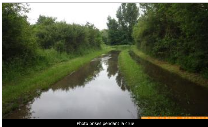
Photo prises pendant la crue