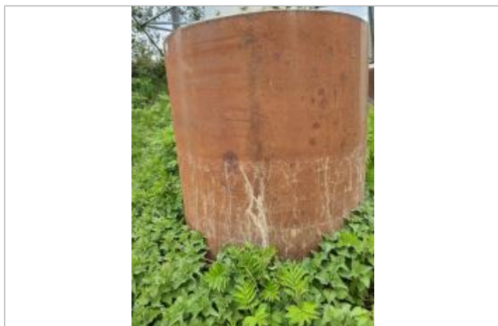
Vue du site, mars 2026.