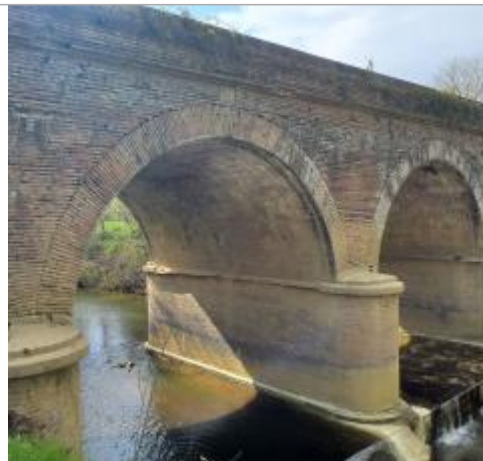
Vue du site, mars 2026, prise de vue SPC GTL.