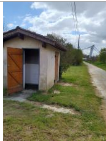
Vue du site, mars 2026.