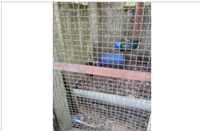
Vue du site, mars 2026.