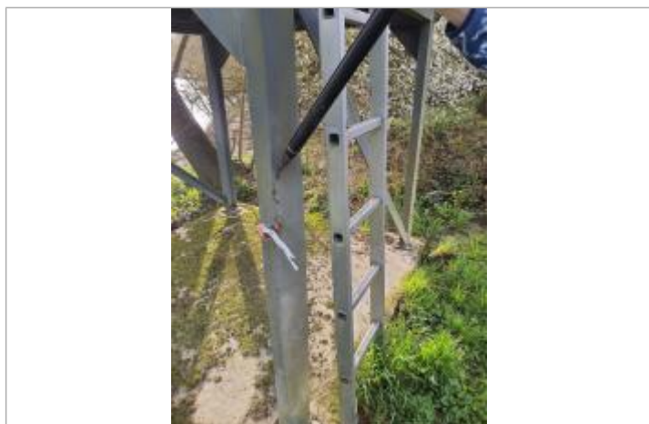
Vue du site, mars 2026, prise de vue SPC GTL.