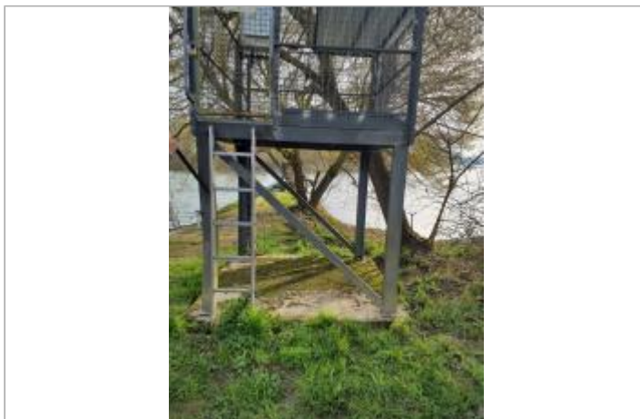
Vue du site, mars 2026.