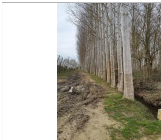
Vue du repère, mars 2026.