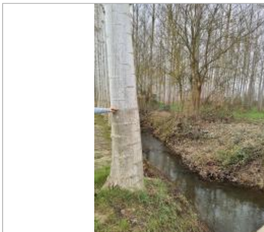
Vue du site, mars 2026, prise de vue SPC GTL.