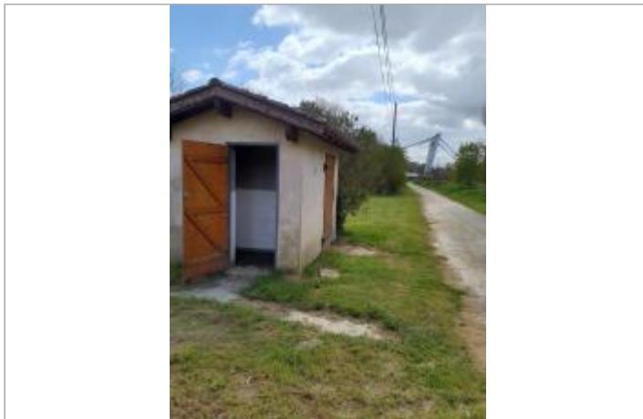
Vue du site, mars 2026, prise de vue SPC GTL.