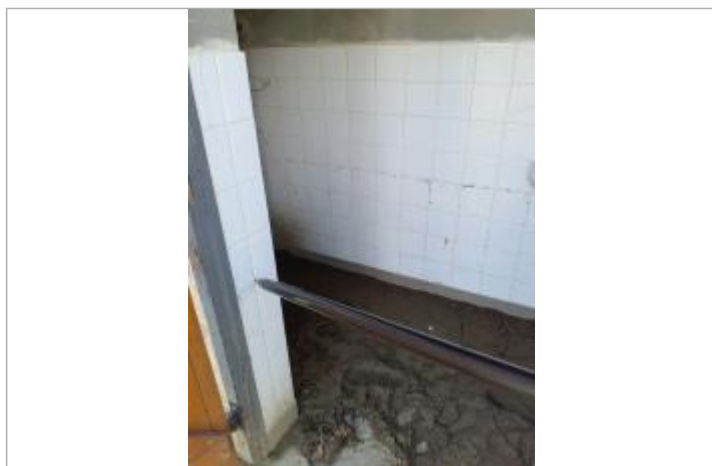
Vue du repère, mars 2026.