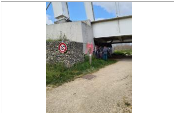
Vue du site, mars 2026.