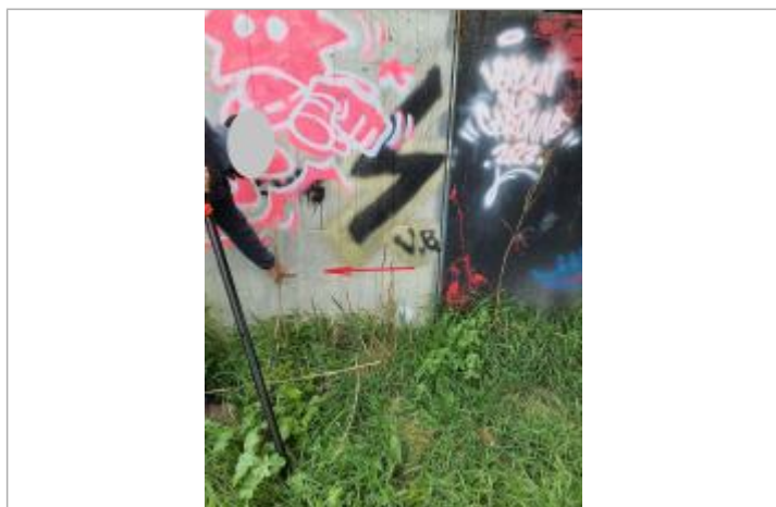
Vue du site, mars 2026, prise de vue SPC GTL.