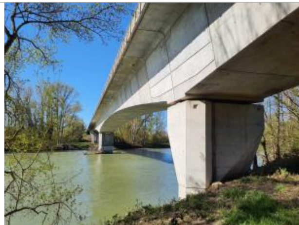
Vue du site, mars 2026, prise de vue SPC GTL.