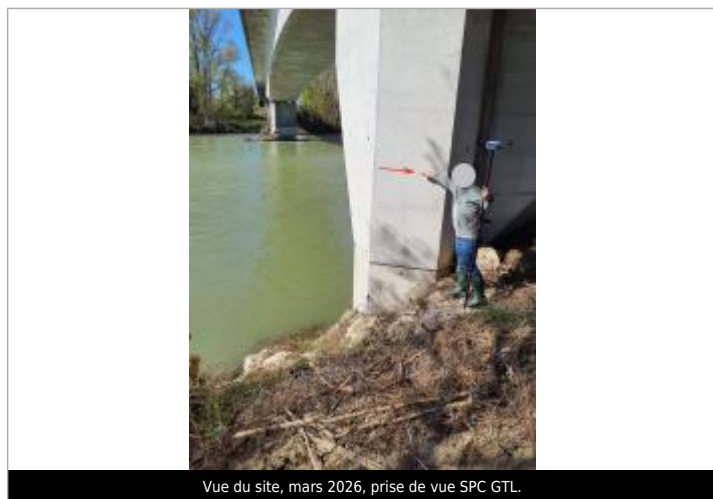
Vue du site, mars 2026.