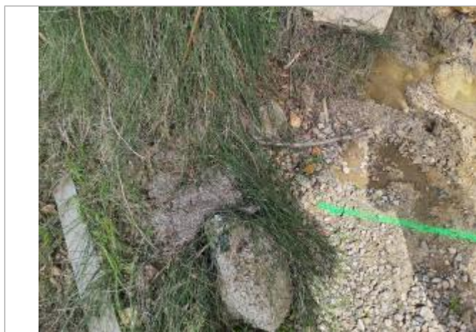
Vue du site, mars 2026, prise de vue SPC GTL.