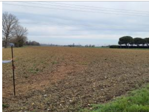
Vue du site, mars 2026, prise de vue SPC GTL.