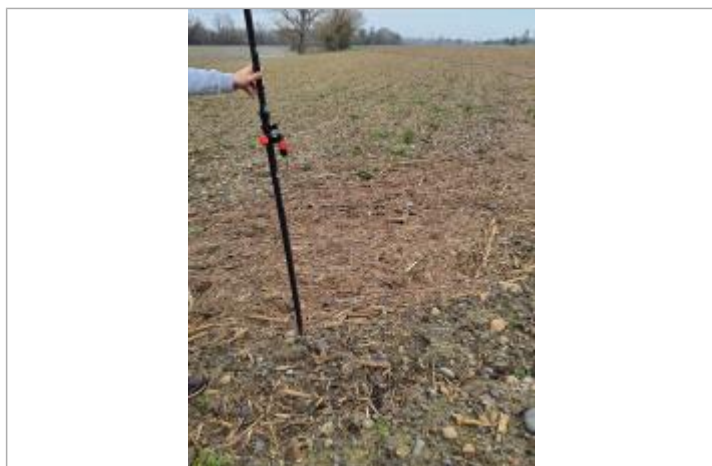
Vue du site, mars 2026, prise de vue SPC GTL.