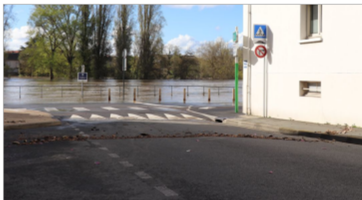
Vue de la laisse - Auteur : DDT86

Organisme(s) : SPC Vienne - Charente - Atlantique