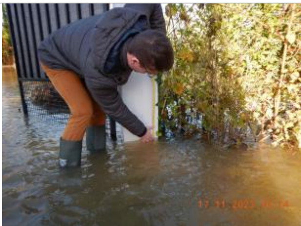
Debordement de cours d'eau