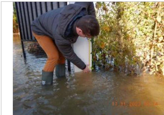
Debordement de cours d'eau