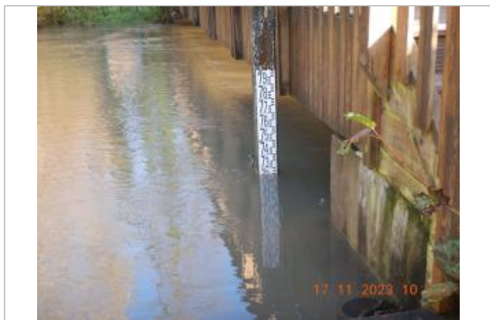
Debordement de cours d'eau