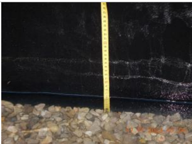
Debordement de cours d'eau