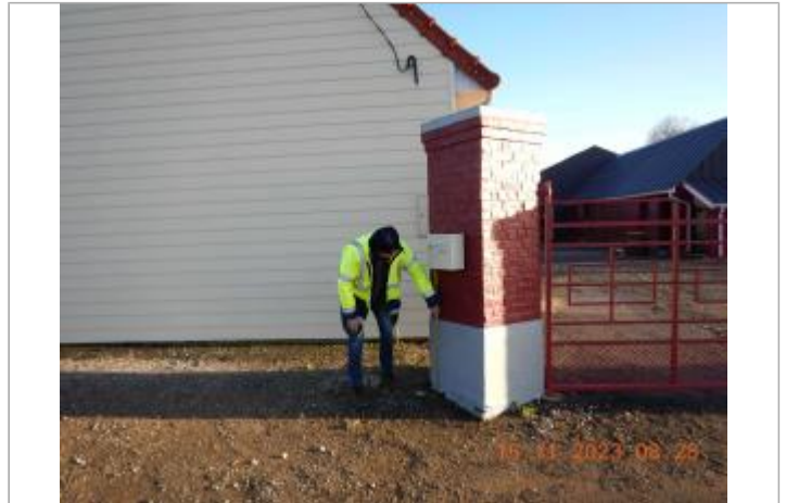
Debordement de cours d'eau