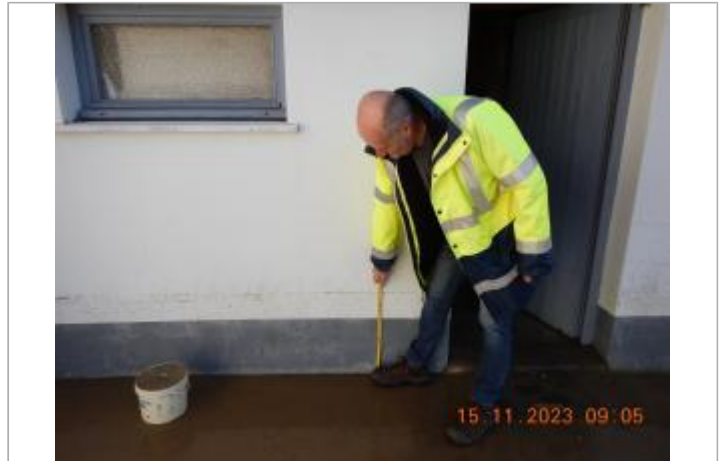
Debordement de cours d'eau