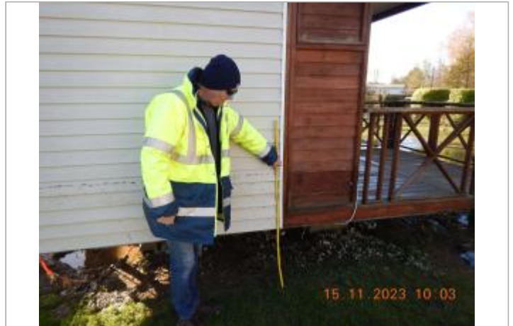
Debordement de cours d'eau