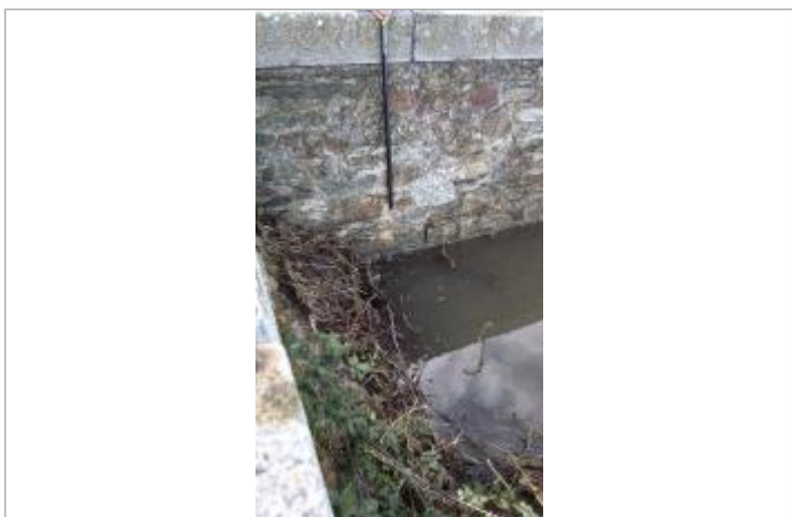
Vue sur la laisse d'inondation et le point de mesure