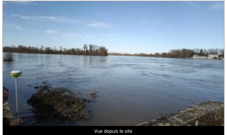
Vue depuis le site